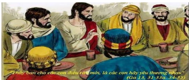
Thầy ban cho các con điều rửa tội, là các con hãy yêu thương nhau. (Ga 13, 31-33a, 34-35)

Xin Thiên Chúa ban bình an cho ông bà và anh chị em. Rev. Kiên Kiêu