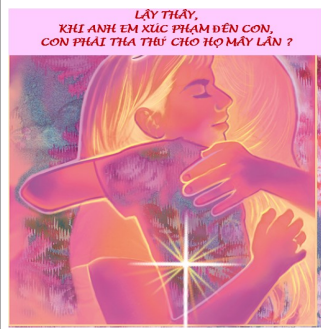
LÀY THẤY, KHỈ ANH EM XÚC PHẠM ĐẾN CON, CON PHẢI THẢ THỨ CHO HỌ MẤY LẦN ?

Dụ ngôn Chúa Giê-su trong Tin Mừng hôm nay nhắc nhở chúng ta về lòng trắc ẩn của Thiên Chúa. Tội lỗi to lớn nhân loại phạm đã được tha thứ và xóa sổ. Cũng trong phương cách tương tự, chúng ta phải tha thứ cho tha nhân. (Bản quyền © J. S. Paluch Co.)